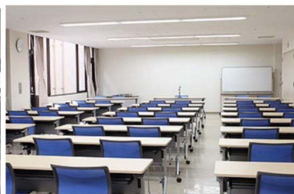
会議室 (70名) (11月21日の講演会会場)