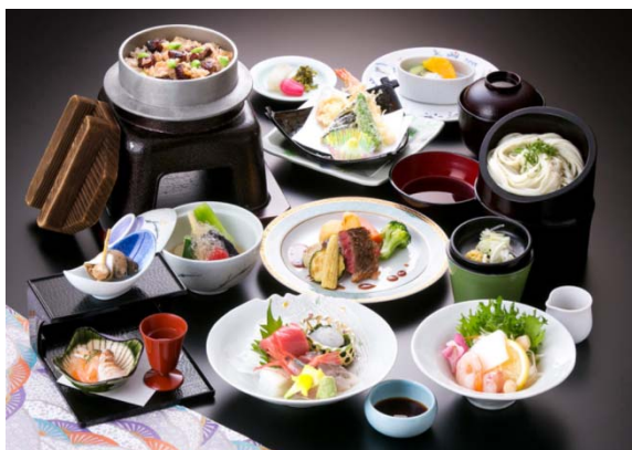
料理 (内容は異なるかも)